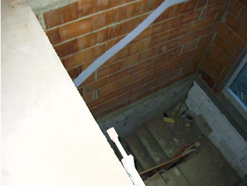
Bild 2 Fehlende Arbeitssicherheit