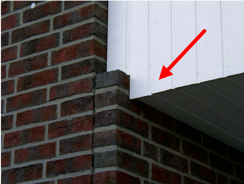
Bild 8 Hohlraum/Loch unter dem Kehlblech