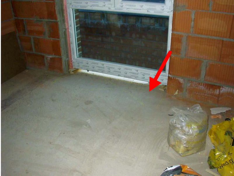
Bild 12 Porenbetonstein sitzt zu nah am Fensterrahmen