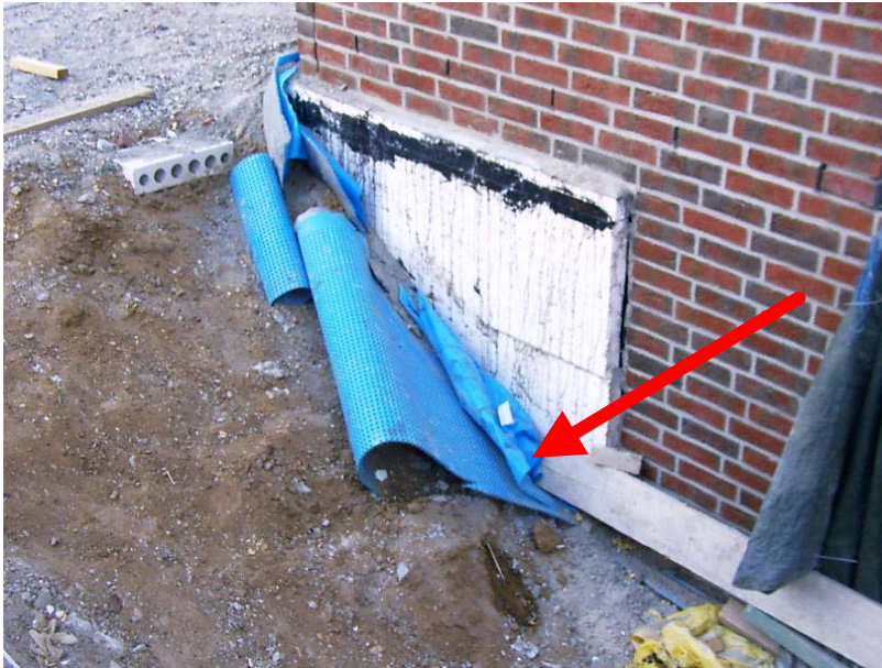
Bild 6 Äußere Fensterabdichtung fehlt noch