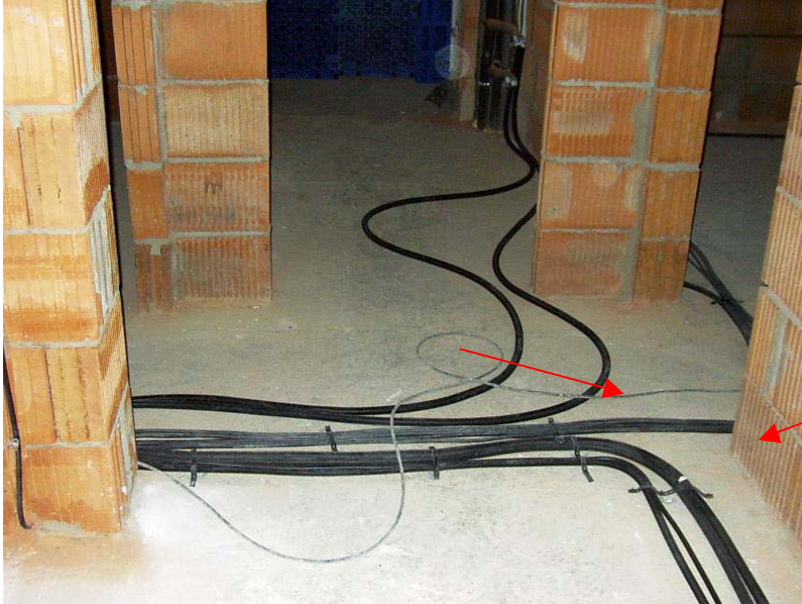
Bild 4 Stein auf Dämmung gemauert