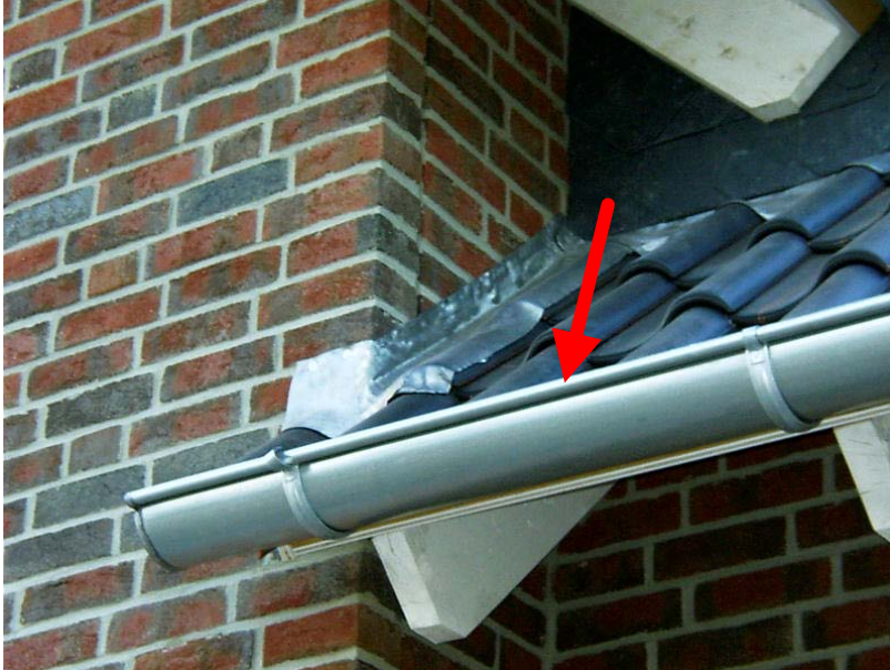
Bild 10 Fehlende unter Abdichtung